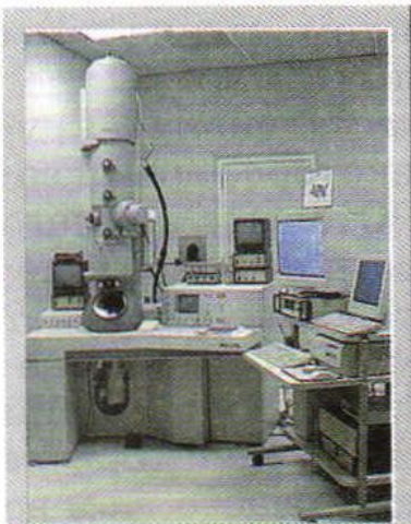
Электронный микроскоп позволяет получать изображения с увеличением до 10^6 раз

Если бы можно было уложить в один ряд вплотную друг к другу 10 000 000 (или 10^7 ) молекул воды, то получилась бы ниточка длиной всего в 2 мм. Малый размер молекул позволяет получить тонкие плёнки различных веществ. Капля масла, например, может растекаться по воде слоем толщиной всего в 0,000002 м (или 2 \cdot 10^{-6} м).