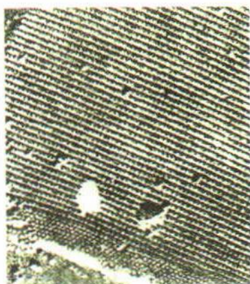
Рис. 21. Молекула белка под микроскопом

Молекулы, в свою очередь, состоят из ещё более мелких частиц — атомов (в переводе с греческого «неделимый»).