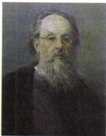
КОНСТАНТИН ЭДУАРДОВИЧ ЦИОЛКОВСКИЙ