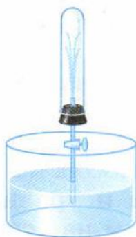
Рис. 126. Поступление воды внутрь сосуда из-за разности атмосферного давления и давления в закрытом сосуде