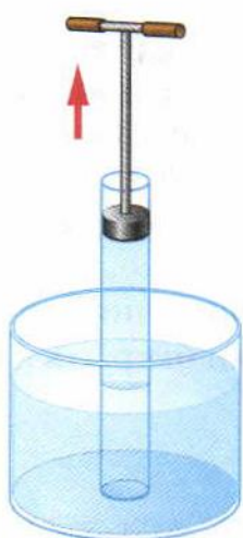
Рис. 125. Подъём воды вслед за поршнем

Это явление используется в водяных насосах и некоторых других устройствах.