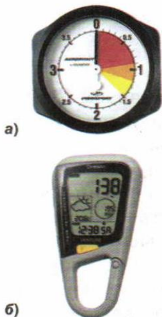
Рис. 137. Высотомеры: а — механический; б — электронный

Нормальное атмосферное давление равно 101\,300\text{ Па} = 1013\text{ гПа} .