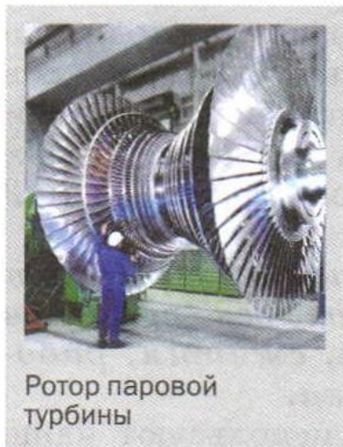
Ротор паровой турбины

В современной технике широко применяют другой тип теплового двигателя. В нём пар или нагретый до высокой температуры газ вращает вал двигателя без помощи поршня, шатуна и коленчатого вала. Такие двигатели называют турбинами .