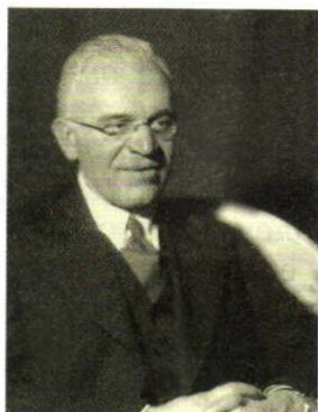
ПАПАЛЕКСИ НИКОЛАЙ ДМИТРИЕВИЧ

Российский физик, академик. Внёс существенный вклад в развитие радиофизики и радиотехники.