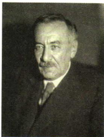
МАНДЕЛЬШТАМ ЛЕОНИД ИСААКОВИЧ