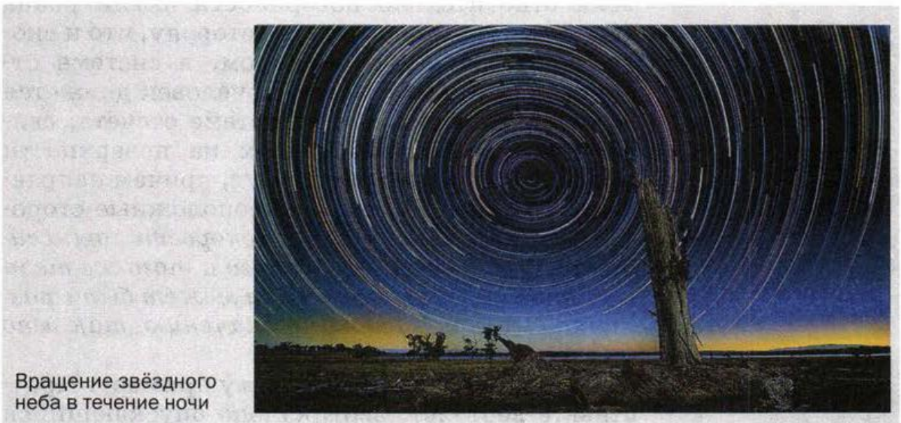
Вращение звёздного неба в течение ночи

Таким образом, относительность движения проявляется в том, что скорость, траектория, путь и некоторые другие характеристики дви-