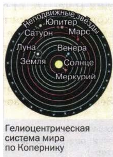
Гелиоцентрическая система мира по Копернику

Новые взгляды на строение Вселенной были подробно изложены в XVI в. польским учёным Николаем Коперником . Он считал, что Земля и другие планеты движутся вокруг Солнца, одновременно вращаясь вокруг своих осей. Такая система мира называется гелиоцентрической , поскольку в ней за центр Вселенной принимается Солнце (по-гречески «гелиос»).