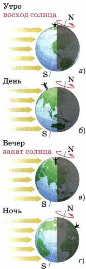
Рис. 18. В гелиоцентрической системе мира видимое движение по небу Солнца днём и звёзд ночью объясняется вращением Земли вокруг своей оси

Таким образом, в гелиоцентрической системе отсчёта движение небесных тел рассматривается относительно Солнца, а в геоцентрической — относительно Земли.