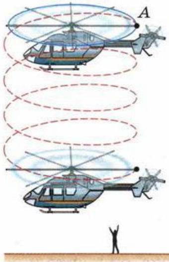
Рис. 17. Относительность траектории и пути

на землю. Относительно вертолётa любая точка винта, например точка A (рис. 17), будет всё время двигаться по окружности, которая на рисунке изображена сплошной линией. Для наблюдателя, находящегося на земле, та же самая точка будет двигаться по винтовой траектории (штриховая линия). Из этого примера ясно, что траектория движения тоже относительна, т. е. траектория движения одного и того же тела может быть различной в разных системах отсчёта.