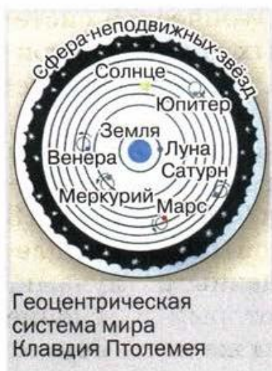
Геоцентрическая система мира Клавдия Птолемея

жения относительно, т. е. они могут быть различны в разных системах отсчёта.