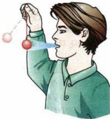
Рис. 83. Пример механического резонанса

ком помещении благодаря набеганию предшествующих звуковых волн на последующие получается наложение звуков, и образуется гул. Для улучшения звуковых свойств больших залов и аудиторий их стены часто облицовывают звукопоглощающими материалами.