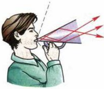
Рис. 82. Принцип действия рупора