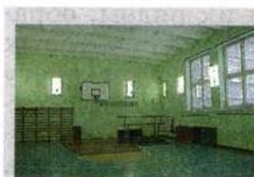
В пустом спортивном зале из-за наложения отражённых от разных поверхностей звуковых волн вместо чёткого звука слышен гул

Большие полупустые помещения с гладкими стенами, полом и потолком обладают свойством очень хорошо отражать звуковые волны. В та-