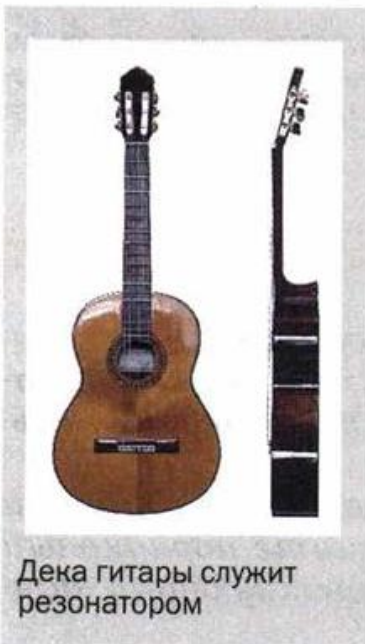
Дека гитары служит резонатором

В музыкальных инструментах роль резонаторов выполняют части их корпусов. Например, в гитаре, скрипке и других подобных им струнных инструментах резонаторами служат деки, которые усиливают издаваемые струнами звуки и придают звучанию инструмента характерную для него окраску — тембр. Тембр звука зависит не только от формы и размера резонатора, но и от того, из какого дерева он изготовлен, и даже от состава лака, покрываю-