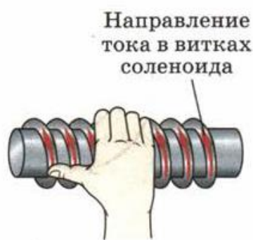
Рис. 97. Определение направления линий магнитного поля внутри соленоида

С помощью правила буравчика по направлению тока можно определить направление линий магнитного поля, создаваемого этим током, а по направлению линий магнитного поля — направление тока, создающего это поле.