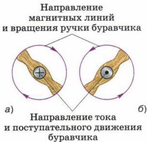
Рис. 95. Применение правила буравчика: проводник с током расположен перпендикулярно плоскости чертежа

Эта связь может быть выражена правилом буравчика (или правилом правого винта ), которое заключается в следующем: если направление поступательного движения буравчика совпадает с направлением тока в проводнике, то направление вращения ручки буравчика совпадает с направлением линий магнитного поля тока (рис. 95, 96).