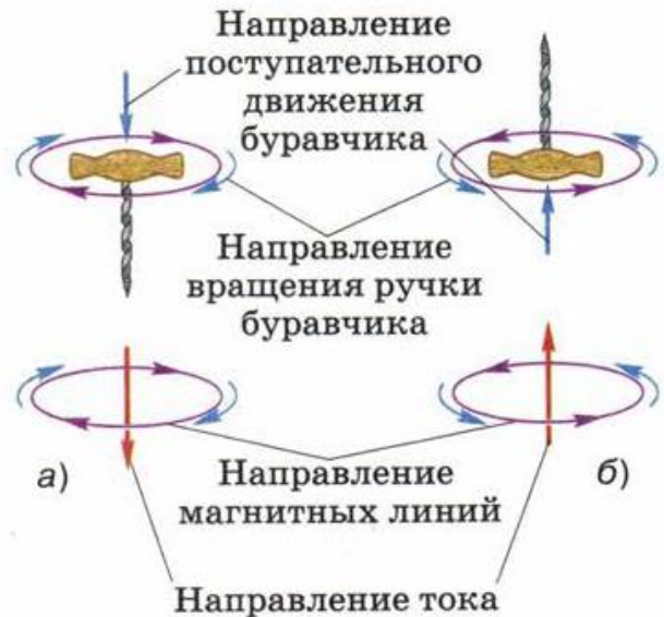
Рис. 96. Применение правила буравчика: проводник с током расположен в плоскости чертежа