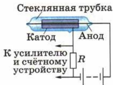
Рис. 159. Схема устройства счётчика Гейгера

Пока газ не ионизирован, ток в электрической цепи источника напряжения отсутствует. Если же в трубку сквозь её стенки влетает какая-нибудь частица, способная ионизировать атомы газа, то в трубке образуется некоторое количество электрон-ионных пар. Электроны и ионы начинают двигаться к соответствующим электродам.