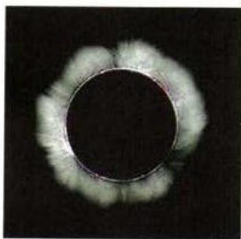
Рис. 190. Солнечная корона (во время полного солнечного затмения 1999 г.)

Перемещение пятен по диску Солнца является следствием его вращения, которое проис-