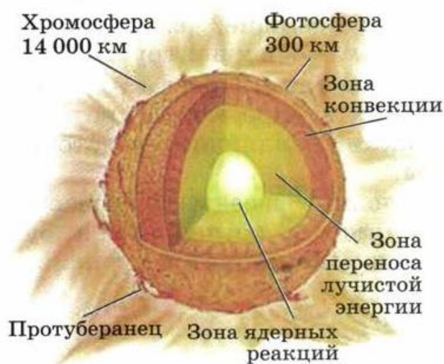
Рис. 188. Строение Солнца

Фотосфера («сфера света») на фотографиях выглядит как совокупность ярких пятны-